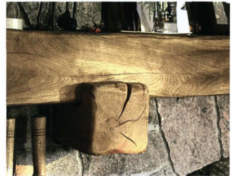
Kamīna maia no eljota ozolkoka. Gandrīz neapstrādāts materiāls rada savdabīgu kontrastu.

Nav jāiejaucas, lai izceltu dabas unikālītāti. Amerikā, Kanādā un Austrālijā, kur ir ļoti attīstītas ekoloģiskās kustības, daudzi labprāt iegādājas mēbeles no zaļa koka. Tās gatavotas no nežāvētas, maksimāli maz apstrādātas koksnes. Arī Latvijā netrūkst amatnieku, kuri strādā līdzīgā manierē.