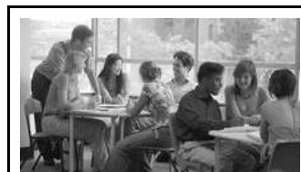
Иностранные студенты могли бы стать серьезной статьей доходов для нашей страны в будущем.

Но еще лучше заинтересованность государства в этом вопросе показывает Интернет. Заходим на разрекламированный latvia.lv ; выбираем английскую версию. "Кликаем" на раздел Education and Science, там — на Vocational Education (профессиональное образование — отдельной ссылки о высшем там почему-то нет), дальше по линку переходим на английскую версию сайта Министерства образования и науки, там нажимаем на Higher Education и... попадаем на девственно чистую страничку. РТУ уже месяцев 8