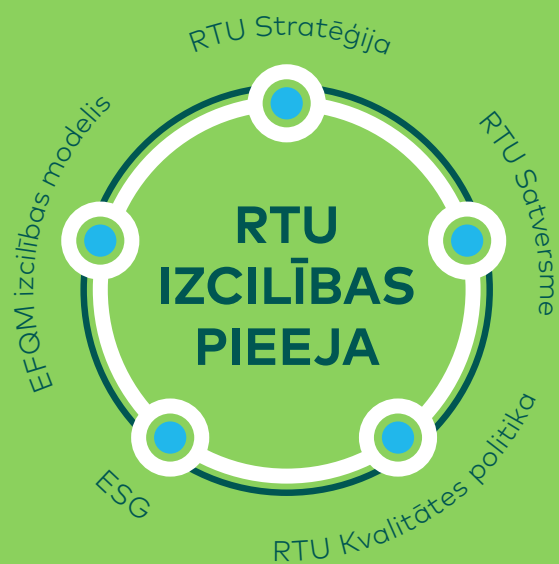
1. attēls. RTU Izcilības pieeja.

Ilgtermiņā attīstības un izcilības sasniegšanā īpaša uzmanība tiek pievērsta vadībai un līderībai, stratēģiskajai plānošanai, procesu pieejai, produktu un pakalpojumu attīstībai, finanšu plūsmas un finanšu rādītāju uzlabošanai, efektivitātes paaugstināšanai visās darbības jomās, studentu, sadarbības partneru un darbinieku apmierinātības veicināšanai un plašāka tirgus apgūšanai.