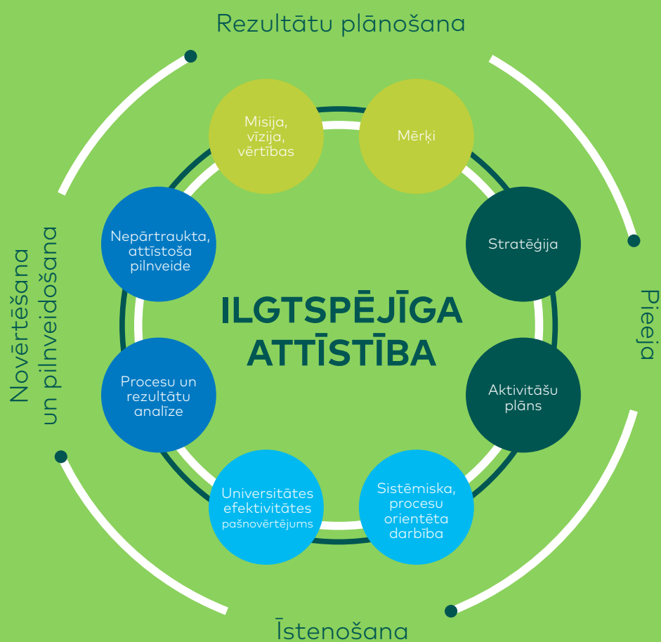
2. attēls. RTU Izcilības pieejas procesa soļi.

Līdz ar Izcilības pieejas ieviešanu Rīgas Tehniskā universitāte definējusi procesa soļus izcilības sasniegšanai. RTU Izcilības pieejas procesa soļi (skat. 2.att.) atspoguļo RTU organizācijas kultūru un kalpo kā vienota valoda universitātes kvalitātes jautājumu izpratnei, lai veicinātu ilgtspējīgu attīstību un universitātes mērķu sasniegšanu.