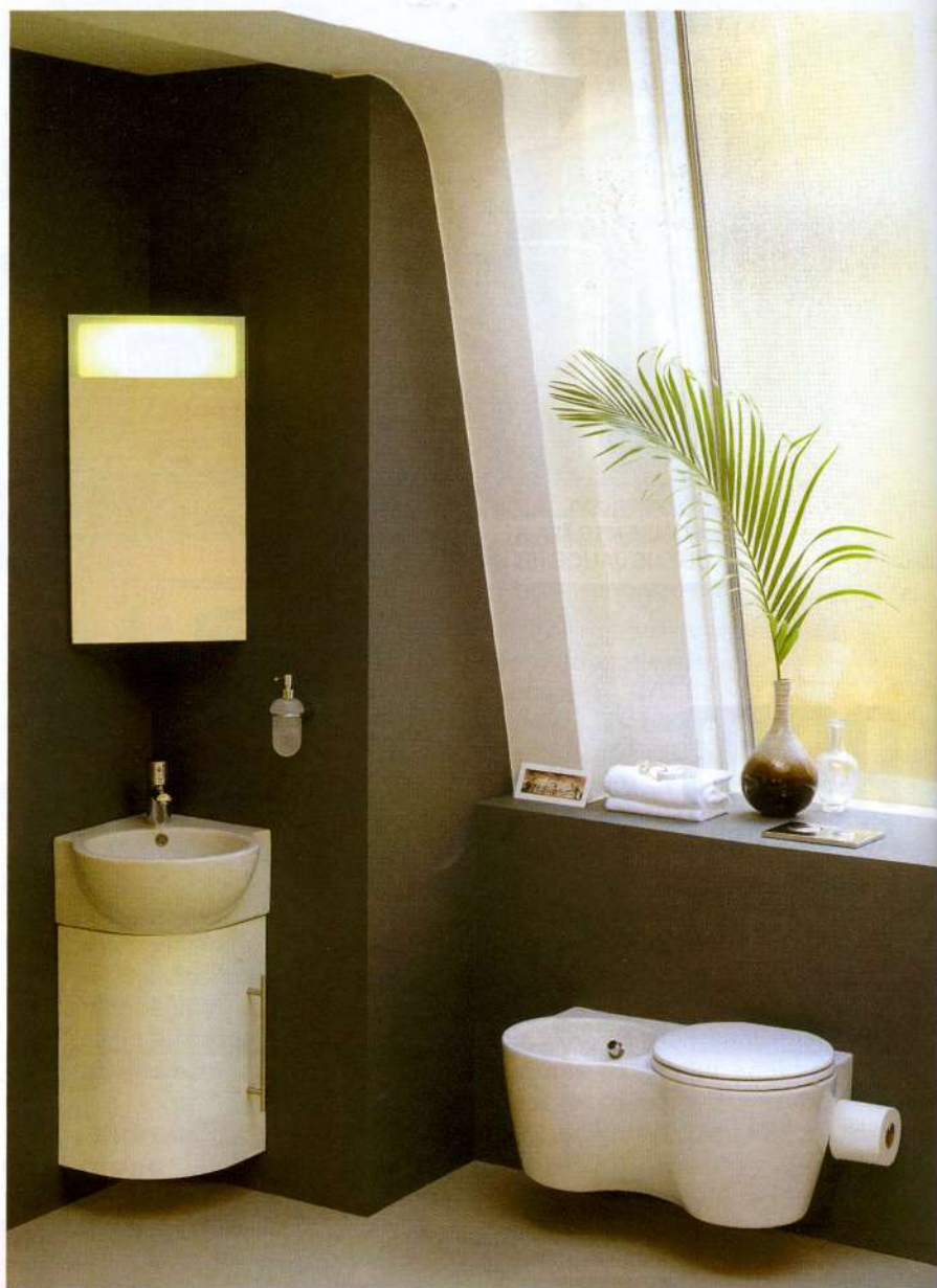
Meklējumi pēc dizaina un tehnoloģiju harmonijas dizainerus ir noveduši līdz formu minimālismam.

Vannasistabas iekārtojums modernā izpratnē ir miera un relaksācijas telpa, kur valda skaidrs, lakonisks dizains, saistībā ar harmoniski veidotām formām. Meklējumi pēc dizaina un tehnoloģiju harmonijas, dizainerus ir noveduši līdz formu minimālismam un dabas formu atdarināšanai. Katrs sīkāka elements vannasistabā tiek pasniegts kā neatņemama telpas koncepcijas sastāvdaļa.