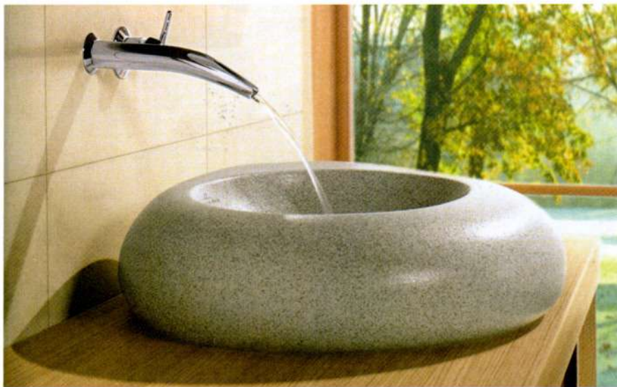
Vienkāršība, kas rada pilnības sajūtu – tā paši dizaineri apraksta šodien aktuālo stilu sanhnikas piedāvājumā un vannasistabu iekārtojumā.

nebūtu šaubu, ka jaunai formai un materiālam ir nevainojamas īpašības.