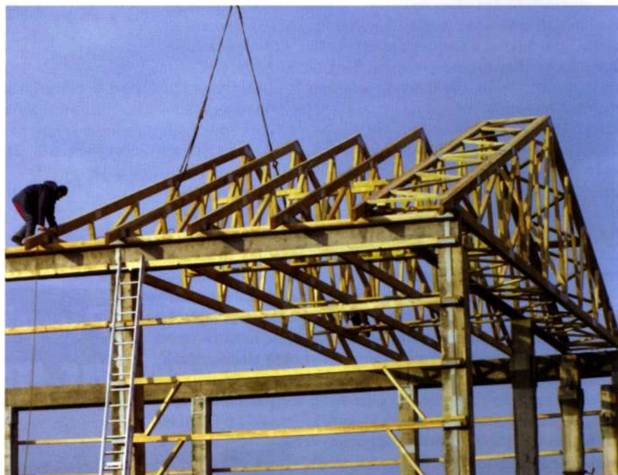
Teksts: Jānis Jansons, «AIG»