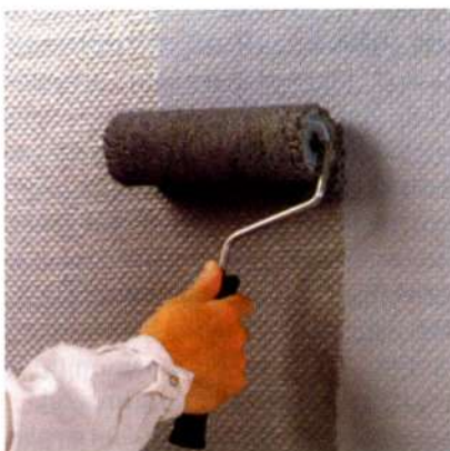
Interesantas faktūras panāk, mainot krāsošanas virzienu.

Ekskluzīvas produkcijas klāstu no augstas kvalitātes materiāliem piedāvā firmā «Reaton». Šai firmai ir trīs galvenie piegādātāji: vācu firma «Rasch», itāļu «Murella», amerikāņu «York».