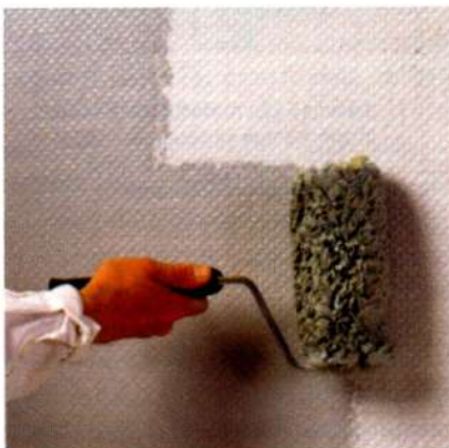
Tapesu krāsošana, izmantojot speciālus palīg līdzekļus.