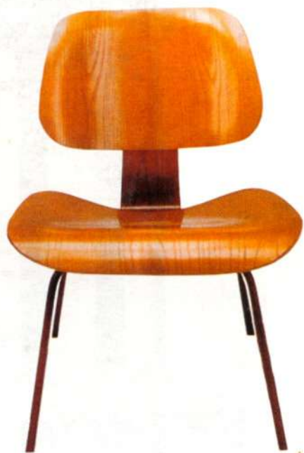
Čārlza Īmsa limēta finiera saplākšņa forma vienkārša un eleganta.