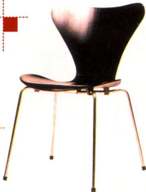
Arnes Jakobsena 1952. gadā ra-dītais krēsla modelis «Skudra».