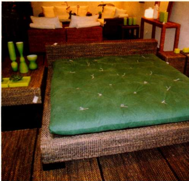
Gultas apvalks ir izveidots no pinuma.