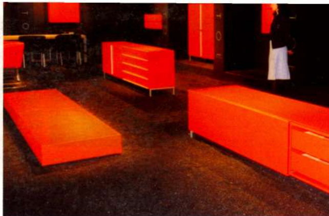
Sarkanā un melnā dominante.

Es mānītos, ja apgalvotu, ka apskatīju visus paviljonus. Astoņus, kas bija veltīti klasiskajām mēbelēm ( classico ), es pat nedomāju apskatīt. Diviem izskrēju cauri, ejot uz paviljoniem, kas mani interesēja, un konstatēju, ka tajos liela daļa apmeklētāju ir no tā paša reģiona kā «Armani First Collection» (pati dārgākā līnija) veikālā redzētā publika, proti, tie bija arābi. Šo veikalu, starp citu, ir projektējis Klaudio Sil-