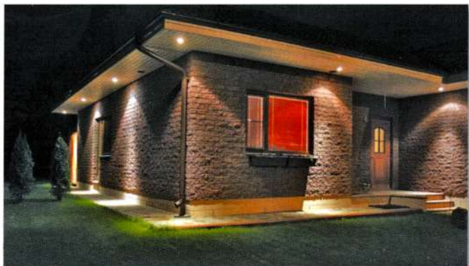
3. att. Šķelto apdares ķieģeļu siena mākslīgajā apgaismojumā.