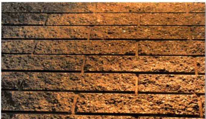
4. att. Fasādes apšuvums, veidots no Columbia-Kivi šķeltajiem apdares ķieģeļiem.

var pievienot krāsu pigmentus, kuru masai nav ieteicams pārsniegt 6% no saistvielas masas. Ja darbi tiek veikti kvalitatīvi, tad var iegūt tiešām dekoratīvu apdari (2. att.). Sevišķi tas attiecas uz celtnēm, kuras ekspluatācijas laikā tiek pakļautas triecieniem, pie-