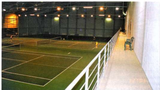
2. att. Sporta zāles sienas apdare, izšuvojot šuves un sienas virsmu nokrāsojot.

Veicot izšuvošanu, var lietot krāsainu javu. Tā var būt gatava sausā maisījuma veidā vai javai