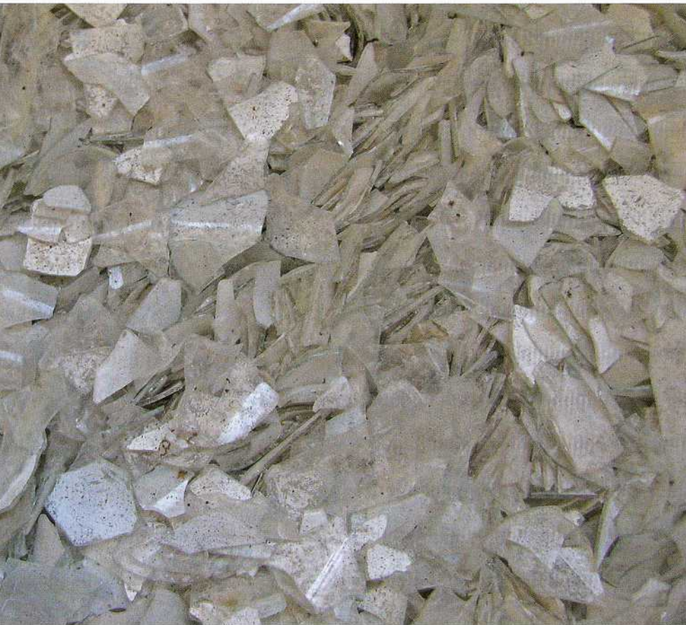
Portlandcements aizstāšana ar stikla atkritumiem 0-40% aprēķinātās spiedes stiprības rezultāti