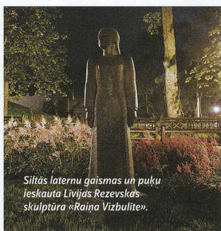
Siltās laternu gaismas un puķu ieskauda Livijas Rezevska skulptūra «Raina Vizbulīte».

PASŪTĪTĀJS - KULDĪGAS NOVADA PAŠVALDĪBA. PROJEKTA AUTORI - ARHITEKTE DIĀNA ZALĀNE, AINAVU ARHITEKTE MARTA TABAKA, PIEDALOTIES MĀRĪŅAM LŪŠENAM, KRISTĪNE VEINBERGAI, ANDREJAM KOROTKOVAM, ANDREJAM STIPRAJAM, INDULIM PAKALNĪTIM, NAURIM INOVSKIM. ĢENERĀLUZŅĒMĒJS - SIA «AVA», BŪVDARBU VADĪTĀJS AIVARS SILIŅŠ. APAKŠUZŅĒMĒJI - SIA «MĀRĪNDĀRZS», IK «RIETUMU DARBNĪCA», SIA «CVS», SIA «SAN-B», SIA «AKVEDUKTS». PIEGĀDĀTĀJI - SIA «VENTBETONS V», SIA «PRO STAGE», SIA «AKVEDUKTS», SIA «M-CARGO», SIA «TALCE», SIA «SAN-B», IK «RIETUMU DARBNĪCA», «BLĪDENE», «MĀRĪNDĀRZS», ZS «BĒRZIŅI», SIA «EVA DĀRZAM», «AKMENSČUČIŅAS». PROJEKTS - 2009. GADS. BŪVNICĪBA - 2010.-2011. GADS. KOPĒJĀ PLĀTĪBA - 33 520 M 2 , APBŪVES LAUKUMS - 480,8 M 2 . BŪVNICĪBAS IZMAKSAS - LS 785 929.